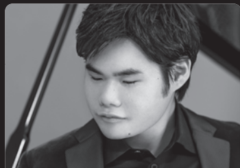
辻井伸行 | ピアノ Nobuyuki Tsujii, piano

史上最年少で英国王立音楽大学指揮科の学科長に任命された名指揮者と、 日本を代表するオーケストラが奇跡の共演！