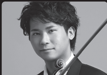
三浦文彰 | ヴァイオリン Fumiaki Miura, violin

2009年6月「第13回ヴァン・クライバーン国際ピアノ・コンクール」において日本人として初優勝を飾る。以来、世界的なピアニストのひとりとして活躍し、ニューヨークのカーネギーホールの主催公演やイギリス最大の音楽祭「プロムス」などに出演し大成功を収めたほか、ウィーン楽友協会やベルリン・フィルハーモニー、パリのシャンゼリゼ劇場などの世界の著名なホールで例年コンサートを開催し、高い評価と多くの聴衆の支持を得ている。また、欧米の一流オーケストラからのソリストとしての出演希望も数多く寄せられ、ゲルギエフやアシュケナージなどの世界的指揮者からも高い評価を受けるほか、2022年にはロサンゼルス・フィルとともにハリウッド・ボウルに出演し5000人の聴衆のスタンディングオベーションを受けるなど世界各地で大成功をおさめている。