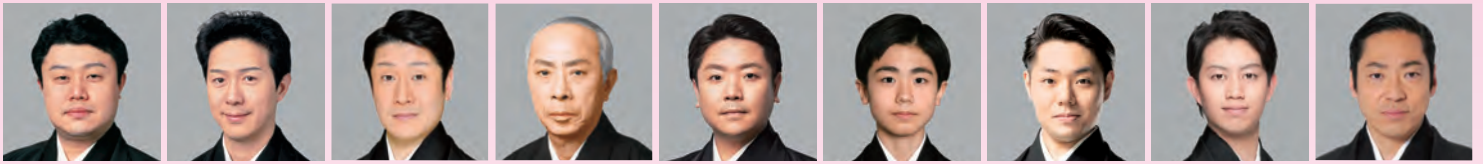
市川猿 弥 市川笑 也 市川笑三郎 市川寿 猿 市川青 虎 市川團 子 中村鷹之資 中村壺太郎 市川中 車