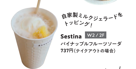
自家製ミルクジェラードをトッピング！ Sestina W2 / 2F バイナッフルフルーツソーダ 737円(テイクアウトの場合)