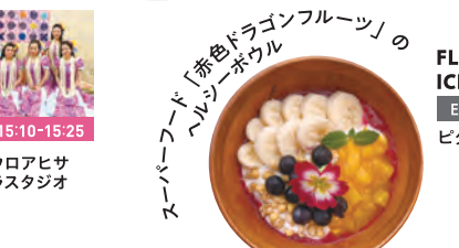
スムーザー「赤色ドラゴンフルーツ」のヘルシーボウル FLOWERS BAKE & ICE CREAM E1 / 2F ビタヤボウル 1,150円