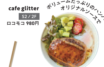
カフェグリッター 2F / 2F ロコモコ 980円

ALOHA MENU イベント期間中限定 GREEN SPRINGS内5つの店舗にてアロハなオリジナルテイクアウトメニューが登場！ ※価格は税込みです。