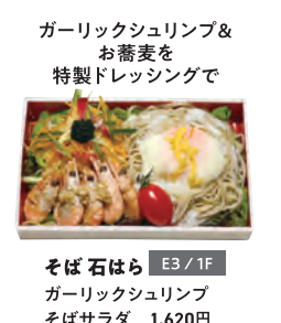
そば石はら ガーリックシュリンプ そばサラダ 1,620円

ALOHA MENU イベント期間中限定 GREEN SPRINGS内5つの店舗にてアロハなオリジナルテイクアウトメニューが登場！ ※価格は税込みです。