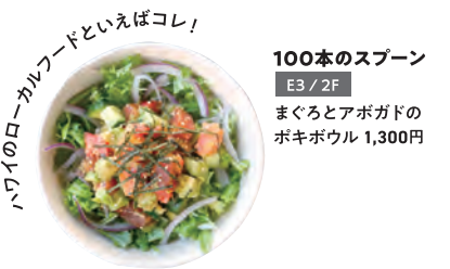
100本のスプーン E3 / 2F まぐろとアボガドのポキボウル 1,300円