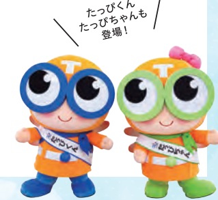
たっぴくん たっぴちゃんも登場！